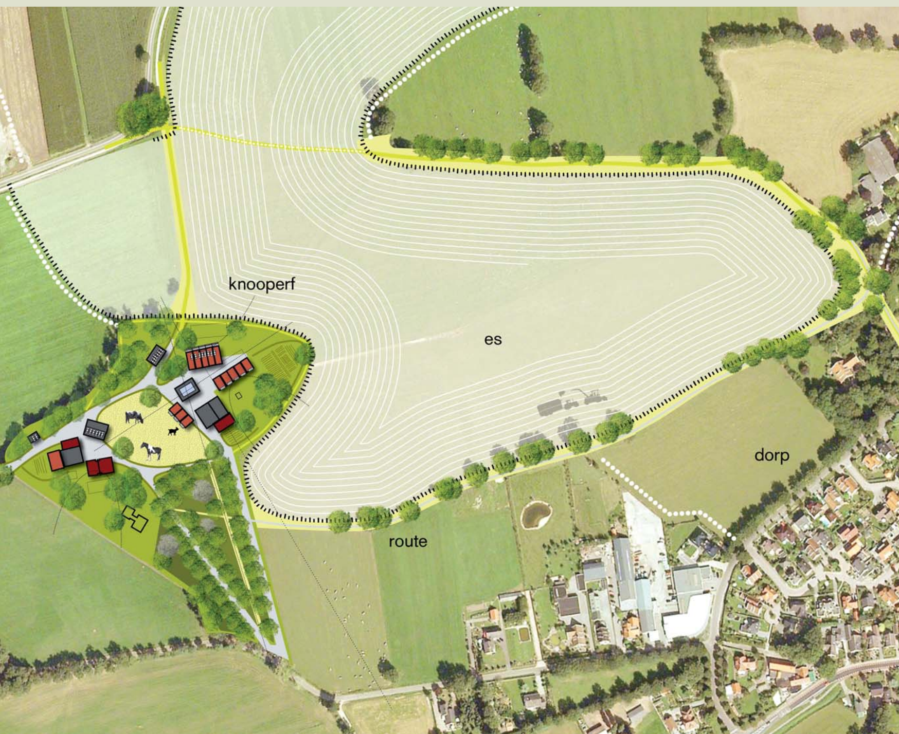
Van Paridon & De Groot, ontwerp knooperf bij Vasse: collage 'wonen aan de centrale ruimte' en kaart beeld Van Paridon & De Groot

voor een goede bedrijfsvoering en dus voortgaande sloop van beplantingen. In 2030 is het aantal burgererven naar verwachting tachtig procent. In antwoord daarop bedachten de ontwerpers een manier om minder fraaie bedrijfsgebouwen in te ruimen voor nieuwe bebouwing waar meerdere burgers kunnen wonen. Met bestaande monumentale gebouwen moeten zo nieuwe ensembles ontstaan van woningen, schuren en tuinen, die recht doen aan de typische kwaliteiten van het erf. Tegelijkertijd kan van de nieuwe bewoners worden