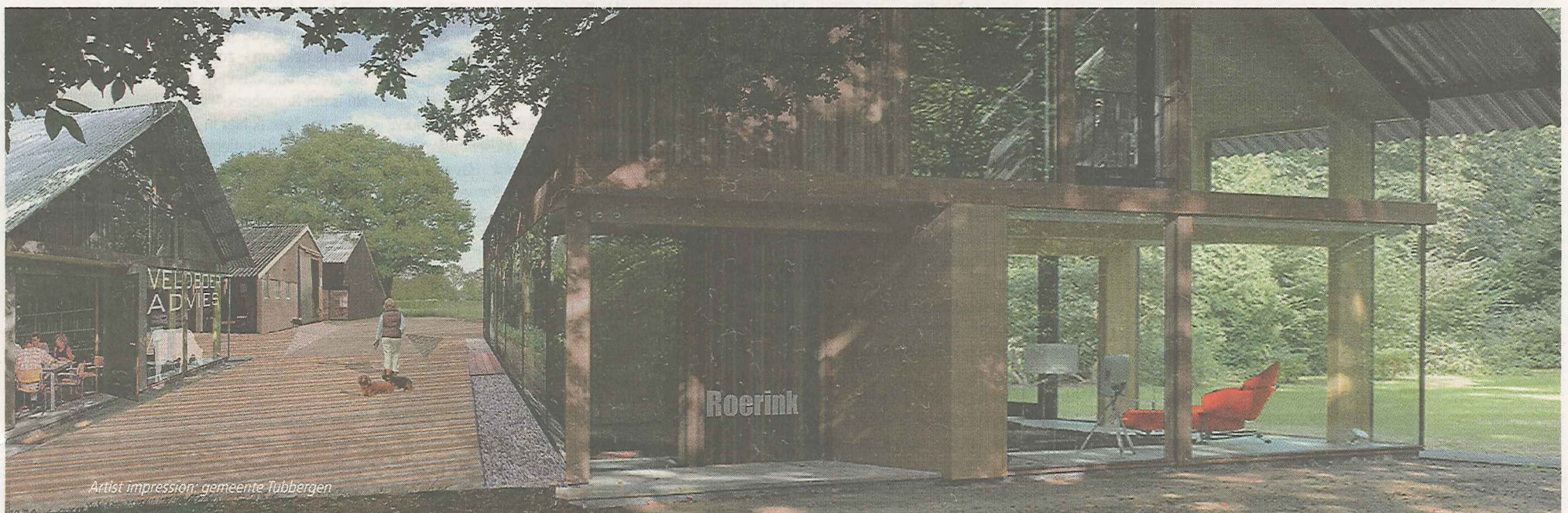
Artist impression: gemeente Tubbergen

Op die manier kunnen er meerdere mensen wonen. Bewoners worden gezamenlijk verantwoordelijk voor het onderhoud van het landschap. Het concept wordt op basis van de ervaringen in Langeveen (zie hoofdverhaal) verder uitgewerkt. Dat gebeurt in samenwerking met de provincie Overijssel, gemeente Tubbergen en het InnovatieNetwerk.