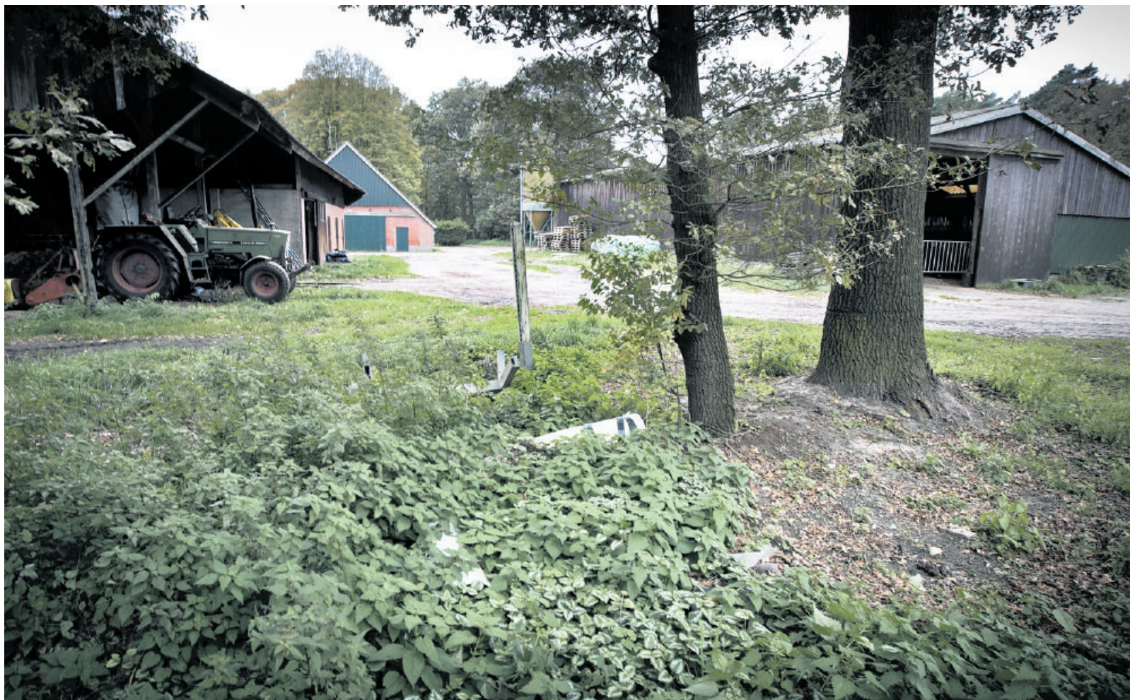
De boerderij die voor het project is aangekocht door de gemeente Tubbergen. Er hoort 4 hectare grond bij.