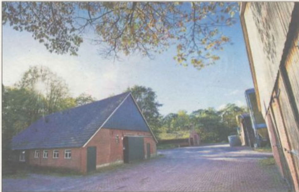
Zo ziet erve De Veldboer aan de Voshaarsweg in Langeveen er nu nog uit. Het beoogde knooperf biedt straks ruimte om te wonen en te werken in het buitengebied.

De gemeente Tubbergen kocht in 2009 het eerste potentiële knooperf aan, aan de rand van Lange-